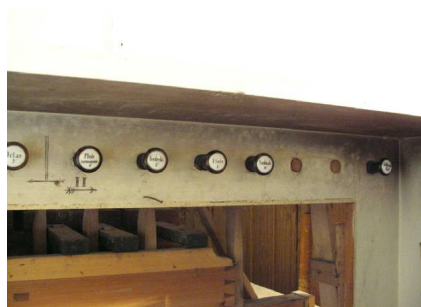
Zwei Registerzüge wurden entfernt