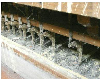
Farbe und Verunreinigungen unter der Pedallade