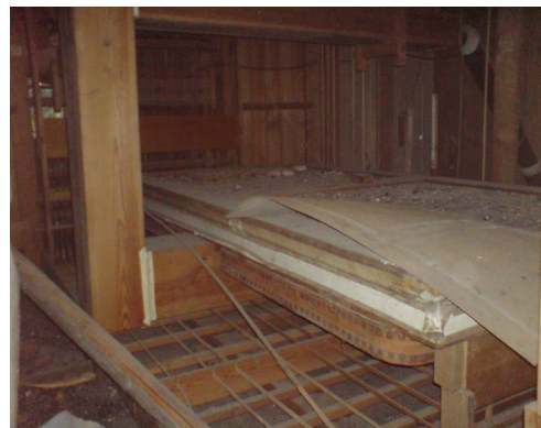
Der Magazinbalg unter den Windladen